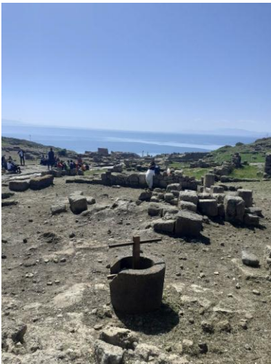
Area archeologica di Tharros