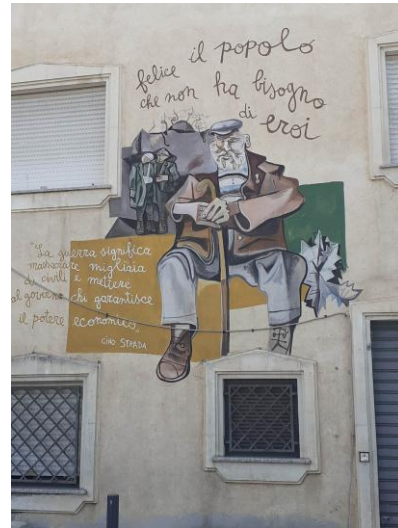
Orgosolo – Murales