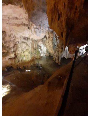
Grotte di Nettuno