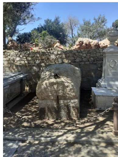
Caprera-Tomba di Garibaldi